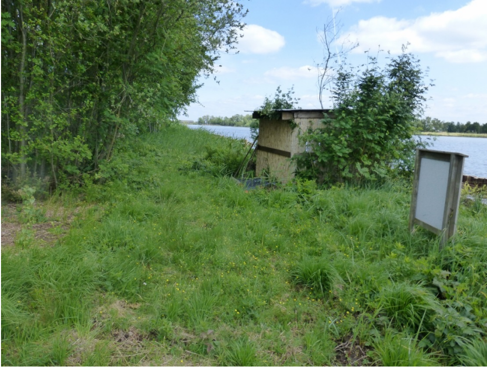
Foto 3: Blik op de plas Kalverbroek/Roggebroek oostwaarts met schiethut