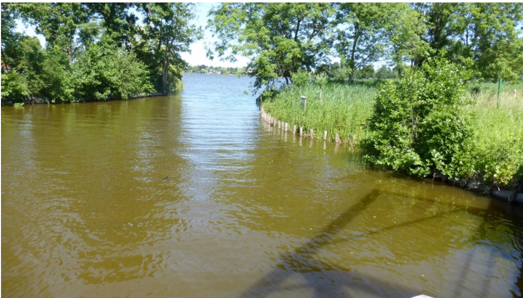
Foto 2: Doorzicht vanaf de brug Zoetendijk-Ree naar 's Gravenbroekseplas. Het oeverland zal hier nog verder beschermd worden door snoeihout achter de palen aan te brengen.