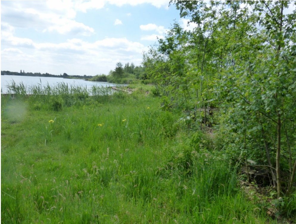
Foto 5: Zicht op de zuidoever van het eiland richting het westen. Links de plas Kalverbroek/Roggebroek.