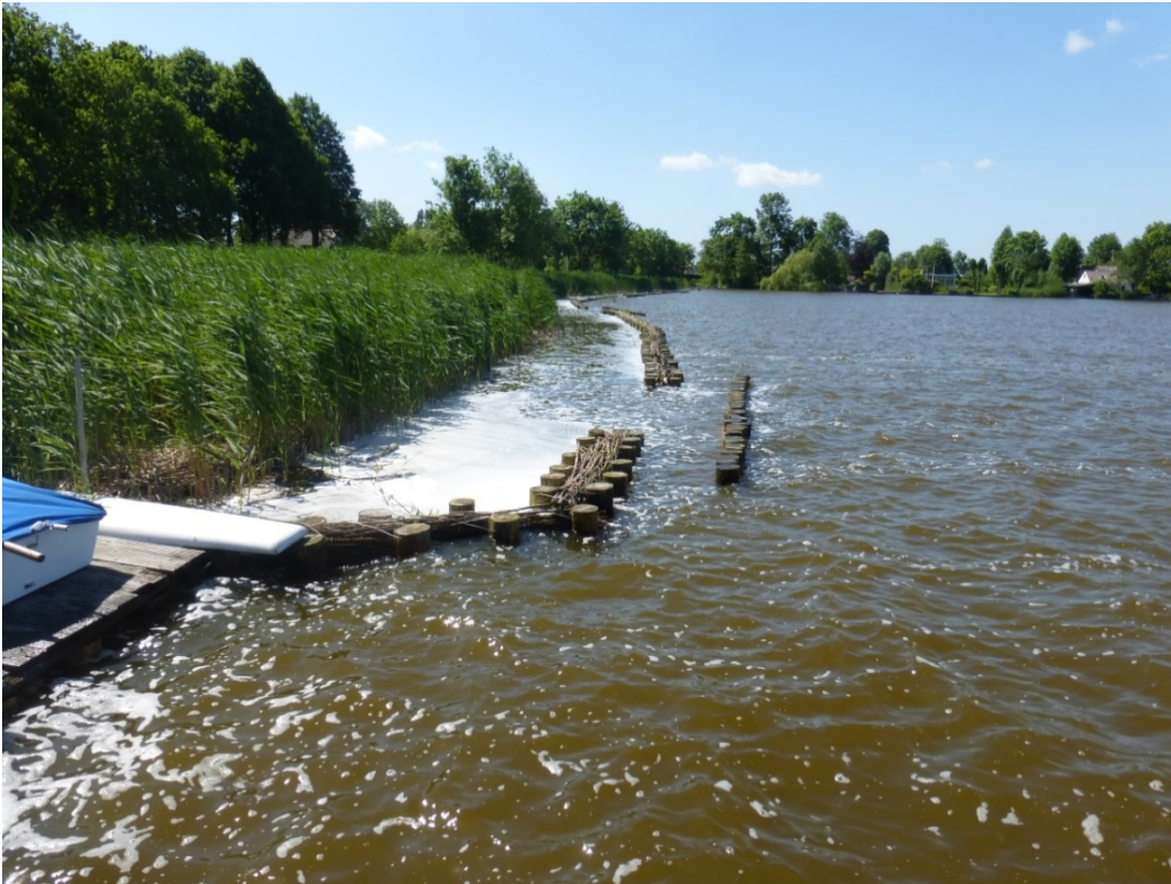
Foto 1: Nieuwe natuurvriendelijke oeverbescherming: palen niet als gesloten rij en slechts 15 centimeter boven het wateroppervlakte