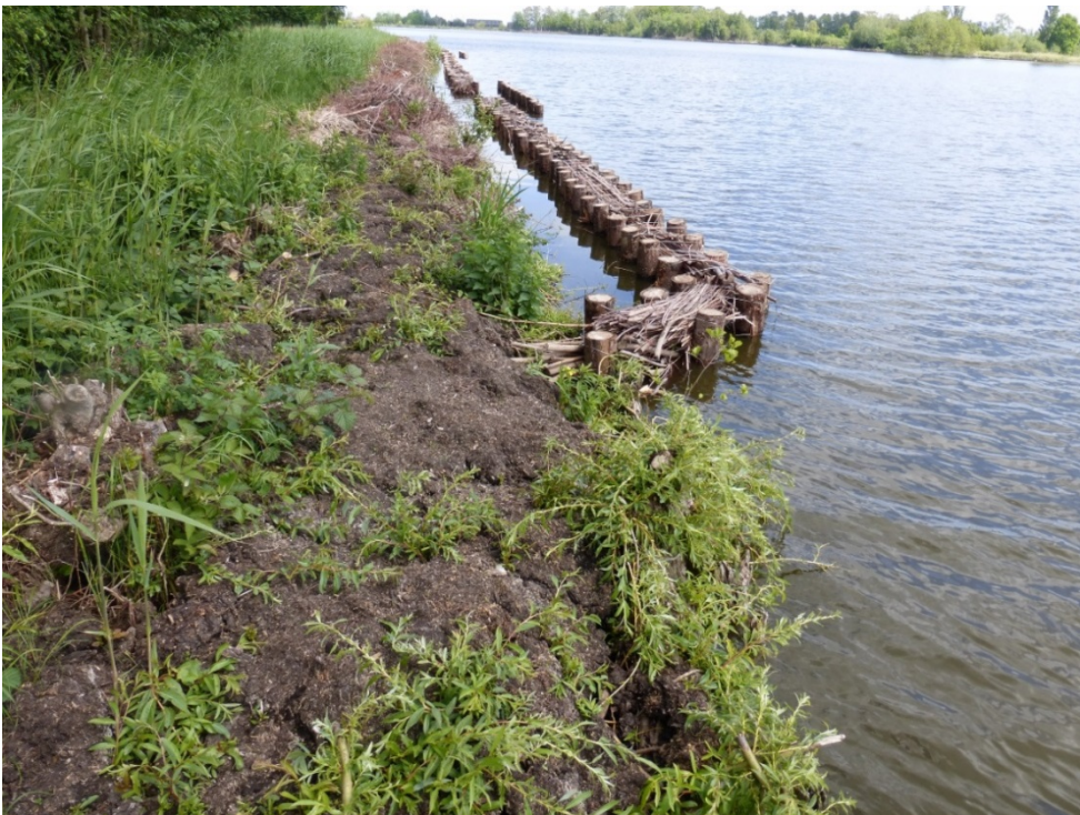
Foto 4: Half-open oeverbescherming aan de zuidzijde van De Schuurwerf. De oude oever is beschermd door jutendoek waarop bagger is aangebracht. Dit geeft een goede bewortelingsmogelijkheid voor de aanwezige moerasplanten.