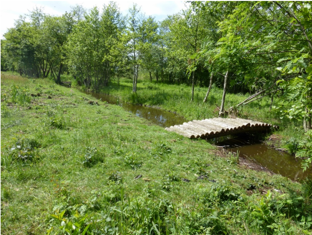
Foto 6: Aan de oostzijde van het eiland zicht op nieuw aangelegd bruggetje over de centrale vaarsloot. Met gebruik making van gesnoeide elzenstammetjes.